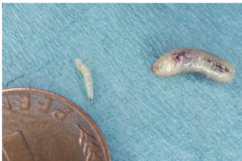
Abbildung 2: Maden der Gattung Lucilia sericata vor und 3 Tage nach Einsatz in einem Ulcus. Figure 2: Fly larvae of Lucilia sericata before and 3 days after application in an ulcer.

Technische Schwierigkeiten bei der Durchführung der Biochirurgie ergeben sich bei zu starker Sekretion oder Austrocknung von Wunden, da Fliegenmaden sowohl ausreichend Sauerstoff als auch genügend Flüssigkeit benötigen [10]. Die Gefahr der Metamorphose zu Fliegen, die zu Vektoren von Kreuzinfektionen werden können besteht bei der Gattung Lucilia sericata nicht, da diese zur Verpuppung ein in Wunden meist nicht vorhandenes trockenes Milieu benötigen würden. Weitere Probleme in der Akzeptanz dieser Vorgehensweise des Debridements können durch die mit der Proteolyse einhergehende intensive Geruchsbelästigung oder durch die Entstehung von Schmerzen durch sich bewegende Maden resultieren. Die Biochirurgie stellt eine innovative und sichere Methode des Debridements dar, die auch ambulant durchzuführen ist.