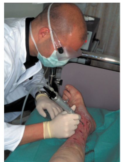
Abbildung 4: Debridement mit niederfrequentem Leistungslautschall. Figure 4: Debridement with low-frequency power ultrasound.

die Implosion resultieren Mikroströmungen und Druckgradienten. Das Ausmaß der Kavitationsbildung ist abhängig von der Viskosität des Mediums und der Ultraschallintensität, die einen definierten Schwellenwert überschreiten muß. Ultraschall niederfrequenter Bereiche ermöglicht ein effektives Debridement chronischer Wunden durch verschiedene Mechanismen. So wird eine weitgehend selektive Nekrosektomie, eine Reduktion der Mikroorganismen, eine Verstärkung der Wirkung von An-